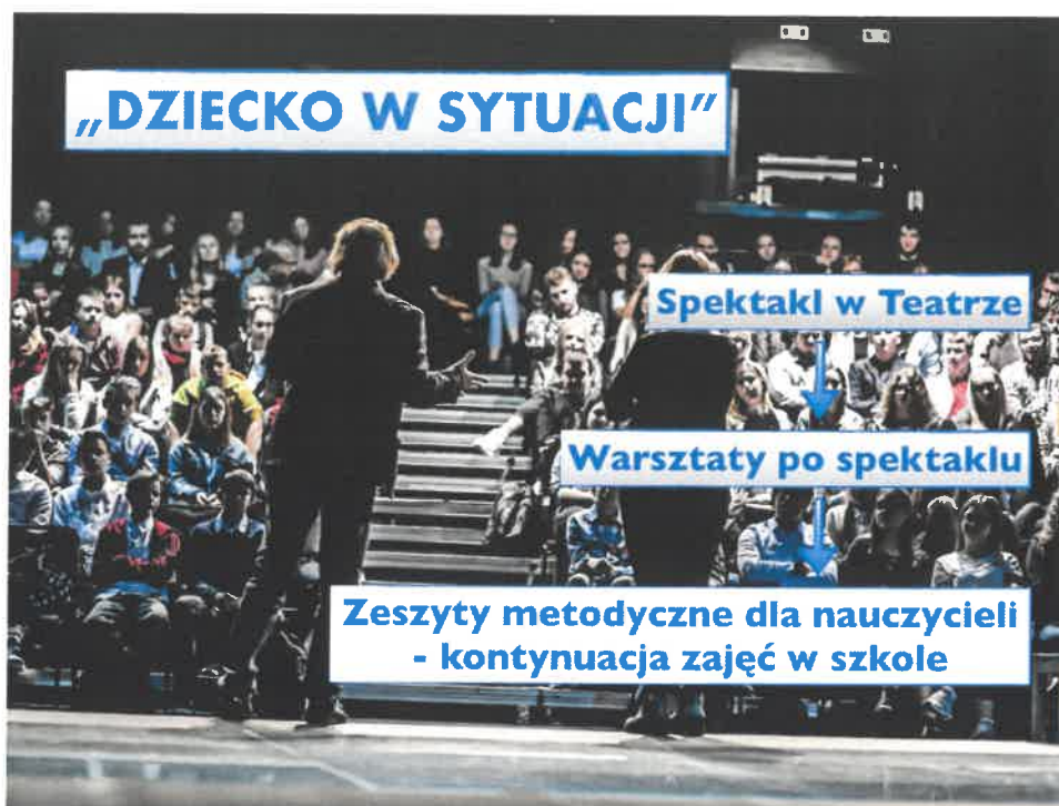
Etapy cyklu „Dziecko w sytuacji”.

Widzowie zaczynają od obejrzenia spektaklu. Po spektaklu odbywają się warsztaty prowadzone przez aktorów Teatru Powszechnego, którym zawsze towarzyszą specjaliści z różnych dziedzin – w zależności od tematyki spektaklu filozof, psycholog, edukator seksualny, alpinista. Projekt zakłada długoterminowe oddziaływanie, dlatego po wizycie w Teatrze Powszechnym w Łodzi nauczyciele mogą skorzystać z „Zeszytów metodycznych” opracowanych indywidualnie pod kątem spektakli z cyklu „Dziecko w sytuacji”. Zeszyty zawierają scenariusze lekcji i zadania związane z tematyką spektakli – m.in., hejtem, sextingiem, rozwodem rodziców, inicjacją seksualną, depresją czy przyjaźnią.