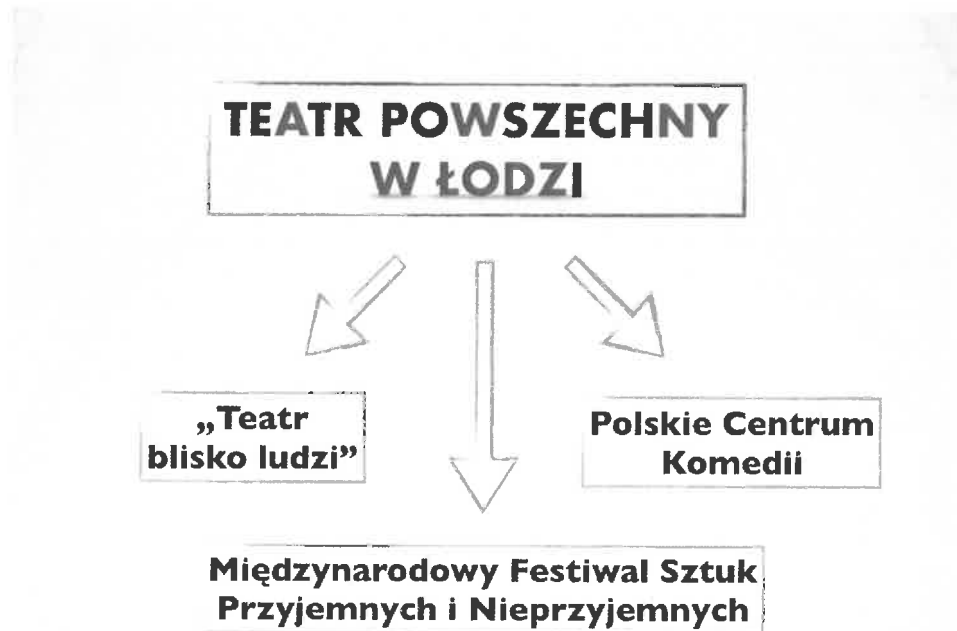
Trzy filary Teatru Powszechnego w Łodzi.

Proponuję kontynuację i rozwój autorskiego programu opartego na trzech filarach: idei „Teatru blisko ludzi”, Polskim Centrum Komедии oraz „Międzynarodowym Festiwalu Sztuk Przyjemnych i Nieprzyjemnych”.